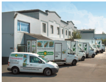
STOLZER FUHRPARK 140 Mitarbeiter beschäftigt das Unternehmen heute

Wie geht so was im Winter? „Meine Vertragslandwirte, überwiegend aus der Region, ernten ihren Salat von April bis Oktober. In der Zwischenzeit kaufe ich Frischware in ausgewählten Betrieben in Frankreich und